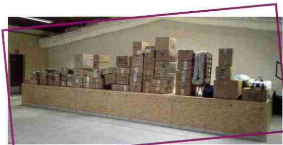
COLLECTE EN UKRAINE