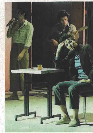
THÉÂTRE 1 ET 2 MARS Et le cœur fume encore 20h, théâtre Legendre