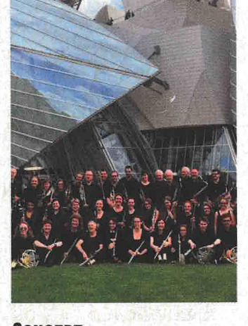
CONCERT 20 MARS Orchestre d'Harmonie d'Évreux 17h, Le Cadran