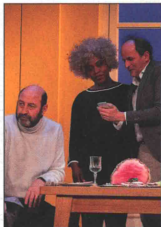
THÉÂTRE 18 JANVIER Amis 20h, Le Cadran