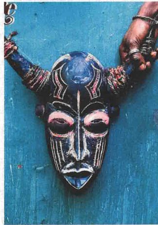
CONCERT 8 JANVIER Vaudou Game 20h, Le Kubb