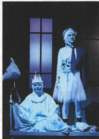
THÉÂTRE 6, 7 (20H), 8 (17H) JANVIER Les Étoiles Théâtre Legendre

+ D'INFOS SUR EVREUXPORTESDENORMANDIE.FR