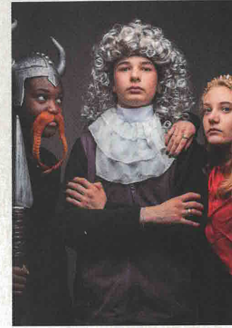
THÉÂTRE 8 MARS Histoire(s) de France 20h, théâtre Legendre