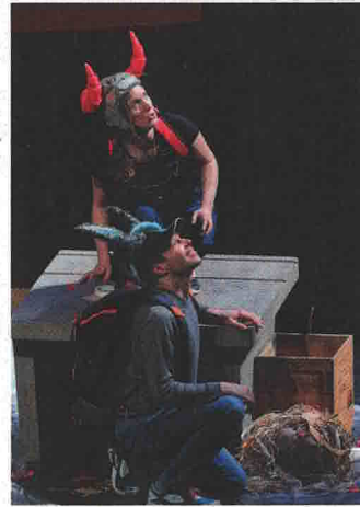
MARIONNETTES 11, 12 JANVIER (20H), 15 (17H) Un Carnaval des animaux Théâtre Legendre