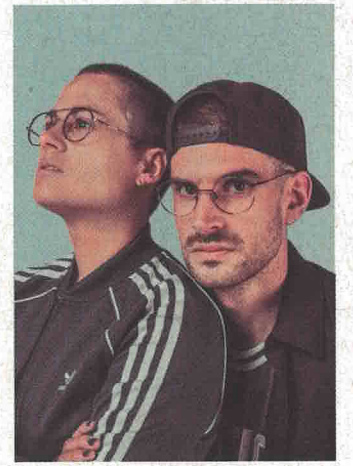
CONCERT 3 MARS Pumpkin & Vin's Da Cuero 21h, Le Kubb