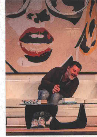
THÉÂTRE 15 MARS L'invitation 20h, Le Cadran